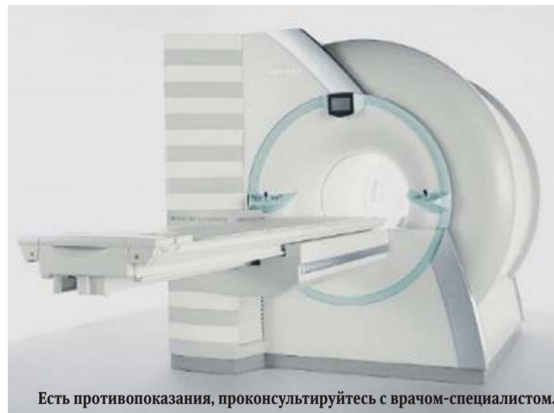
Есть противопоказания, проконсультируйтесь с врачом-специалистом.

Подбор, подготовка и обучение персонала для «МРТ Эксперт» имеют ключевое значение, и этому уделяется много сил и внимания. Компа-