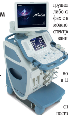
УЗИ-аппарат Toshiba Xario SSA-660

Записаться на обследование можно по телефонам: 8-499-645-53-52, 8-495-722-14-85 . Сайт центра: www.tomograd.ru .