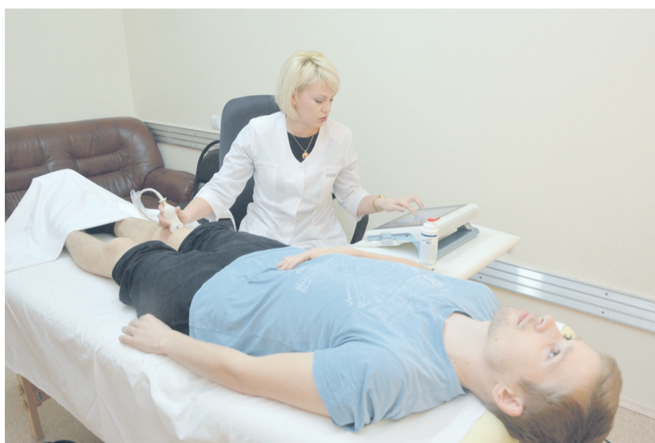
Схема назначения препаратов генной инженерии тоже достаточно сложная. Сначала доктор принимает решение о том, что больному необходимо подобрать такое лечение. Пациент должен пройти специальное дополнительное обследование и на основании результатов обследования, врач дает заключение о возможности получения данным пациентом такой терапии. Затем пациент едет в Московский Городской ревматологический центр на комиссию, где его консультируют профессор и, соответственно, принимают

решение: дать генно-инженерную терапию или нет – она очень дорогостоящая, стоит от 70 до 150 тыс. руб. в месяц. Пациент может получить такую терапию бесплатно при наличии группы инвалидности.