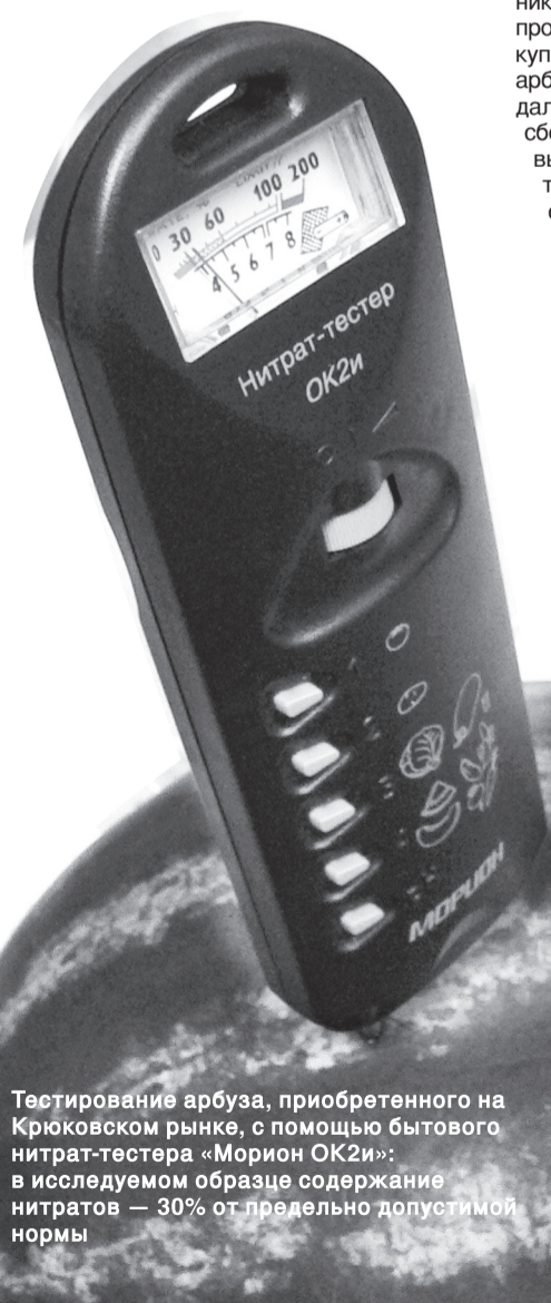
Тестирование арбуза, приобретенного на Крюковском рынке, с помощью бытового нитрат-тестера «Морион ОК2и»: в исследуемом образце содержание нитратов — 30% от предельно допустимой нормы