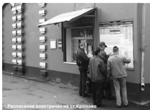
Расписание электричек на ст.Крюково

У Октябрьской железной дороги на участке Москва-Тверь сложилось уникальное положение: работая в условиях отсутствия конкурентов на рынке жд пассажирских перевозок, компания является естественной монополией, что позволяет ей диктовать свои правила. Последнее время «сюжет» развивался слишком стремительно: с декабря по апрель цены на проезд в электричках повышались четыре раза. Напомним, с 1 декабря 2008 года абонемент Крюково-Москва подорожал на 357 рублей, с 1 января 2009 года — на 256 рублей, с 1 марта — на 323 рубля, с 1 апреля — на 274 рубля. То есть меньше чем за полгода стоимость месячных проездных билетов увеличилась в два раза — с 1200 рублей до 2410 рублей.