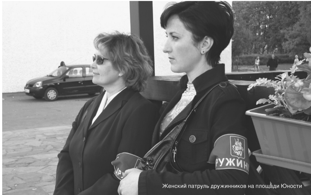
Женский патруль дружинников на площади Юности

В течение 2009 года кадровый состав московской милиции сократится на 15%, общее число сотрудников снизится до 80 тысяч человек. Стоит ли опасаться роста преступности?